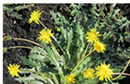
図1 ゴムタンポポ天然ゴム。

そこで本研究では、現在、最も有望視されている代替天然ゴムの一つであるゴムタンポポ（ロシアタンポポ）天然ゴムの高性能化と実用化への展開のために、その最も重要な特徴である伸長結晶化（SIC）挙動を研究する。そして、地震対策用の免震システム用ゴムの観点からその有用性について考察する。