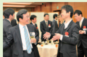
▲受領者と選考委員の歓談の様子

▶▶ http://www.hitachi-zaidan.org/kurata/index.html