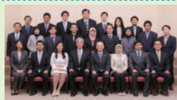
▲卒業式を前に奨学生全員が財団理事長とともに

翌3月12日(木)は、全員がスタディー・ツアーとして、完成したばかりの中央研究所 鳩山サイトにある超高電圧電子顕微鏡、ならびに日立金属熊谷工場の磁性体材料製造現場を見学しました。日頃企業との接点が少ない奨学生にとって、このような見学は貴重な機会となっています。