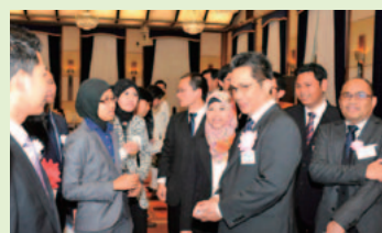
▲マヘンドラ大使(インドネシア)と談笑する奨学生